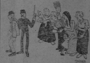
La autoridad se encargó del desorejado.

ga. Sin embargo, entre aquellos tanto no estaba el "hombre malo". La congoja de los vecinos aumentaba. Se pensó en una misa de desagravió, en una rogativa y hasta se le suplicó al Padre Vilá que por tres días y tres noches hiciera repicar las campanas hasta que el sátiro apareciera. Entre los sontos que vivió la joven y de quienes dijo "este no es" hay un honrado comerciante de panela, de "tapas" de dulce; aun cuando estaba fuera de toda sospecha, pero además de ser muy honrado es bien sabido que hasta hoy no ha habido sátiro comerciante de panela, sufrió el careo y salió victorioso. Pero he aquí que un día de tan-