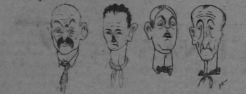
Hicieron comparecer a todos los "sontos"

más aún cuando se empeña en comprar la tanga entera. Ni una tapa le vende nadie y se tiene que conformar con el "sobao" e con algún caramelo que le dan por favor sus viejos clientes que no quieren ya tratos can el. Y allí tienen ustedes a los extremos que conduce la Justicia. Acusado y arruinado, este pobre hombre no tendrá más remedio