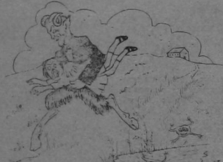
El caso es muy reciente.

sus compras, como la historia na cundido, produce pánico y los hombres se arman de escopetas y las mujeres se tapan con las manos los ojos para no verlo siquiera. Su situación es desesperante. Así cuando salga libre de la tea causa, quedará arruinado. Así nos lo contaba el Agente Varguillas ayer. Llega a una casa donde venden panela y lo reciben mal. —A cómo tiene hoy el "atao", pregunta el pobre a Na Cheta, en el trapiche. Y lo sacan en abreviatura. Y