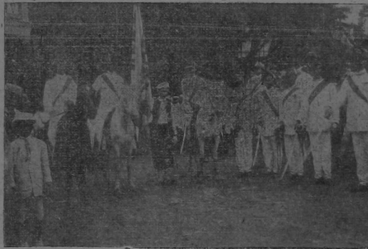
Ginetes preparándose para las carreras de caballos